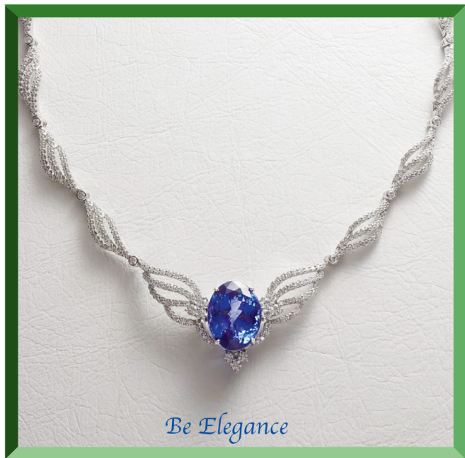
K18WG Tanzanite Necklace T=26.68ct D=8.58ct ¥14,700,000+tax