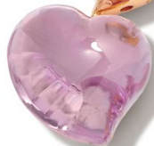
8 Amethyst Necklace K18PG A=8.70ct Side Stone D=0.06ct price ¥147,000