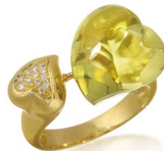
10 Lemon Quartz Ring K18YG Q=8.70ct Side Stone D=0.06ct price ¥178,500