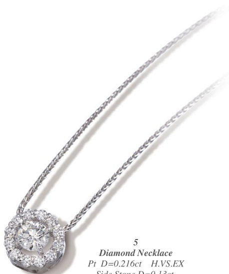
5 Diamond Necklace Pt D=0.216ct H.VS.EX Side Stone D=0.13ct price ¥294,000