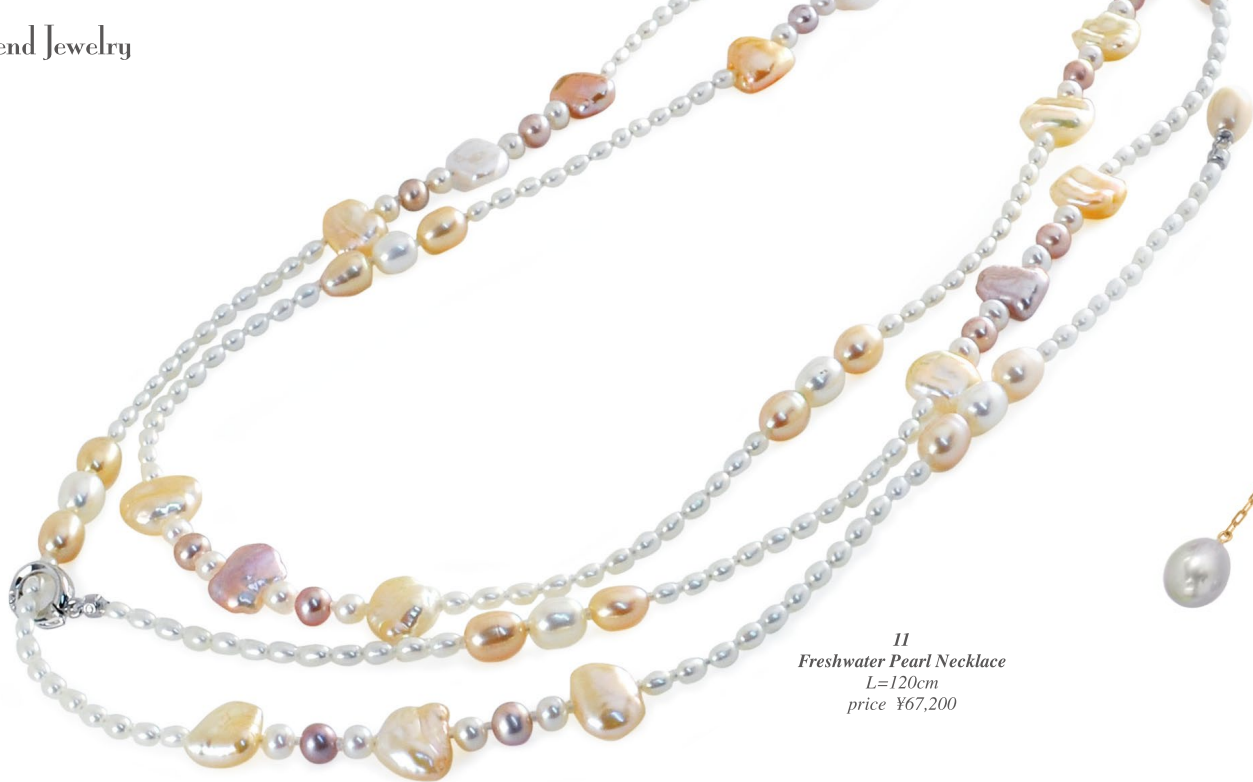
11 Freshwater Pearl Necklace L=120cm price ¥67,200