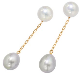
12 Freshwater Pearl pierced Earring K18PG P=8.5 × 9.0mm price ¥81,900