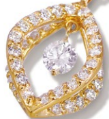
7 Diamond Necklace K18PG D=0.20ct Side Stone D=0.40ct price ¥325,500