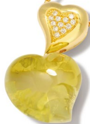
9 Lemon Quartz Necklace K18YG Q=8.70ct Side Stone D=0.06ct price ¥147,000