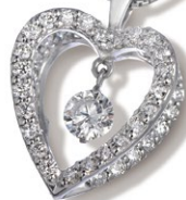
6 Diamond Necklace K18WG D=0.20ct Side Stone D=0.40ct price ¥325,500