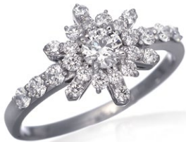
3 Diamond Ring Pt D=0.230ct G.VS.EX Side Stone D=0.49ct price ¥483,000