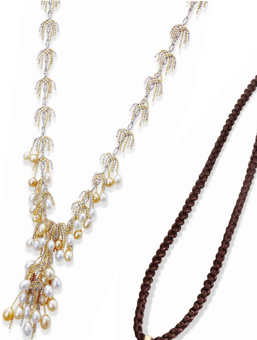
12 K18Y / WG Poppy Pearl Necklace P=4.0~5.0 mm price ¥989,100