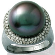
14 K18BG Tahiti Pearl Ring P=14.0 mm up D=0.47ct price ¥588,000