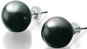
15 K18WG Tahiti Pearl Pierce P=11.0~12.0 mm price ¥84,000