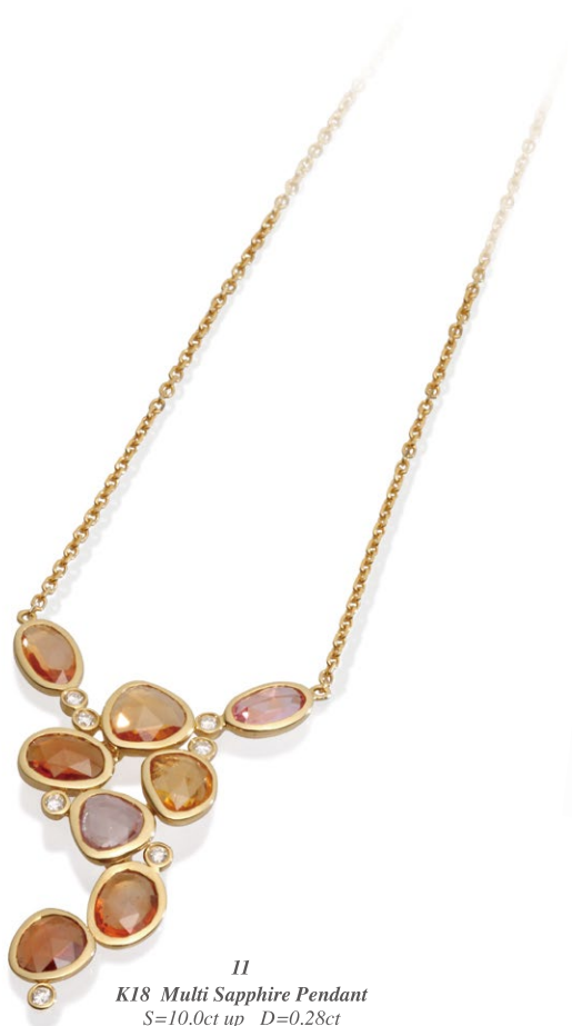
11 K18 Multi Sapphire Pendant S=10.0ct up D=0.28ct price ¥735,000