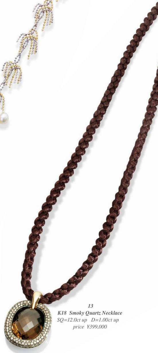
13 K18 Smoky Quartz Necklace SQ=12.0ct up D=1.00ct up price ¥399,000