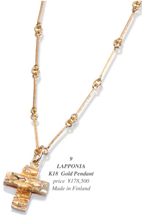
9 LAPPONIA K18 Gold Pendant price ¥178,500 Made in Finland