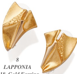
8 LAPPONIA K18 Gold Earring price ¥147,000 Made in Finland