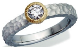
6 Pt K18 Diamond Ring D=0.30ct up F-SI1-EX price ¥399,000