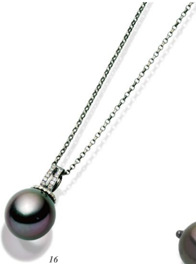
16 K18BG Tahiti Pearl Pendant P=12.0 mm up D=0.19ct price ¥273,000