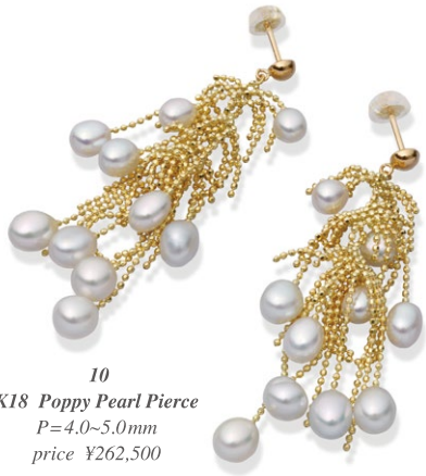
10 K18 Poppy Pearl Pierce P=4.0~5.0mm price ¥262,500