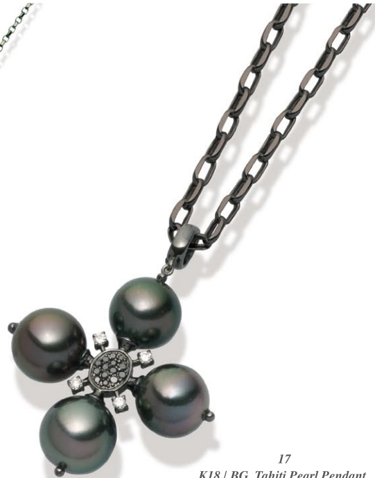
17 K18 / BG Tahiti Pearl Pendant P=11.0~12.0 mm D=0.28ct price ¥378,000