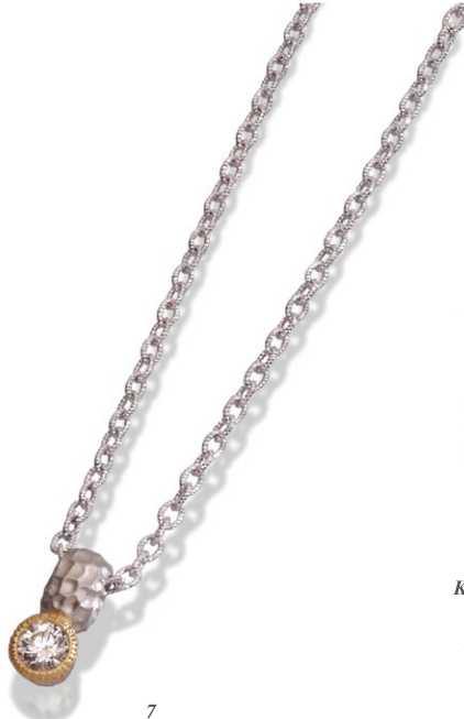
7 Pt K18Y1 WG Diamond Pendant D=0.30ct up F-SI1-EX price ¥336,000