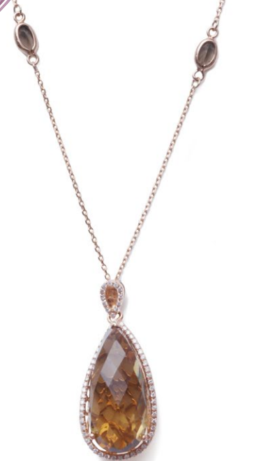
16 K18PG Champagne Quartz Pendant CQ=10.0ct up D=0.18ct up SQ=1.20ct up ¥273,000