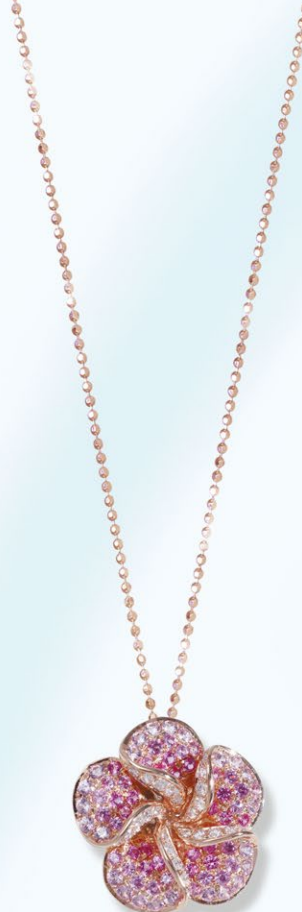
5 K18PG Pink Sapphire Pendant PS=1.32ct D=0.25ct ¥315,000