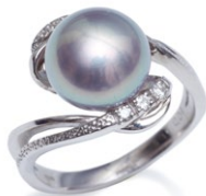
14 K18WG Freshwater Pearl Ring P=10.0 mm up ¥182,700