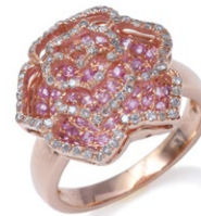
17 K18PG Pink Sapphire Ring PS=0.90ct D=0.35ct ¥346,500