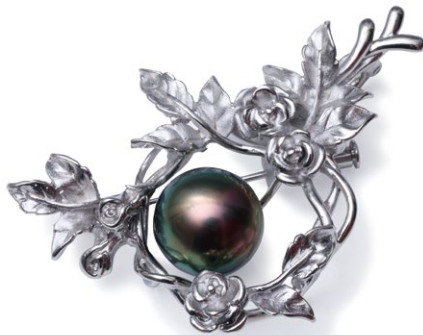
13 Silver925 Tahiti Pearl Brooch P=12.0 mm up ¥105,000