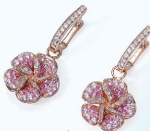
4 K18PG Pink Sapphire Pierced Earring PS=1.10ct D=0.60ct ¥399,000