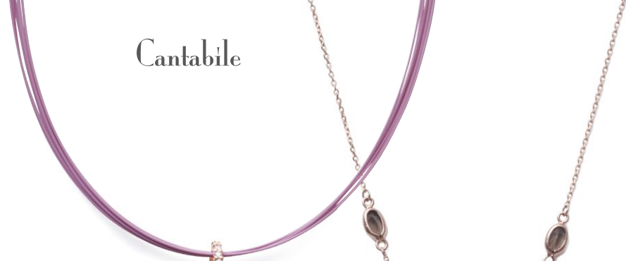
15 K18PG Pink Sapphire Pendant PS=0.95ct D=0.40ct ¥283,500