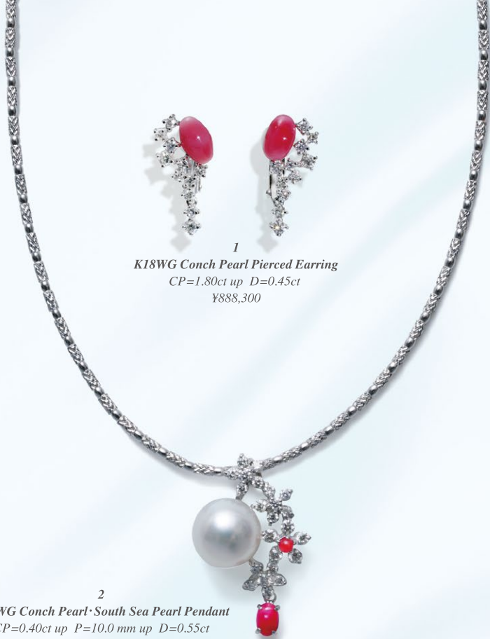
1 K18WG Conch Pearl Pierced Earring CP=1.80ct up D=0.45ct ¥888,300