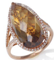
18 K18PG Champagne Quartz Ring CQ=0.90ct up D=0.25ct ¥252,000