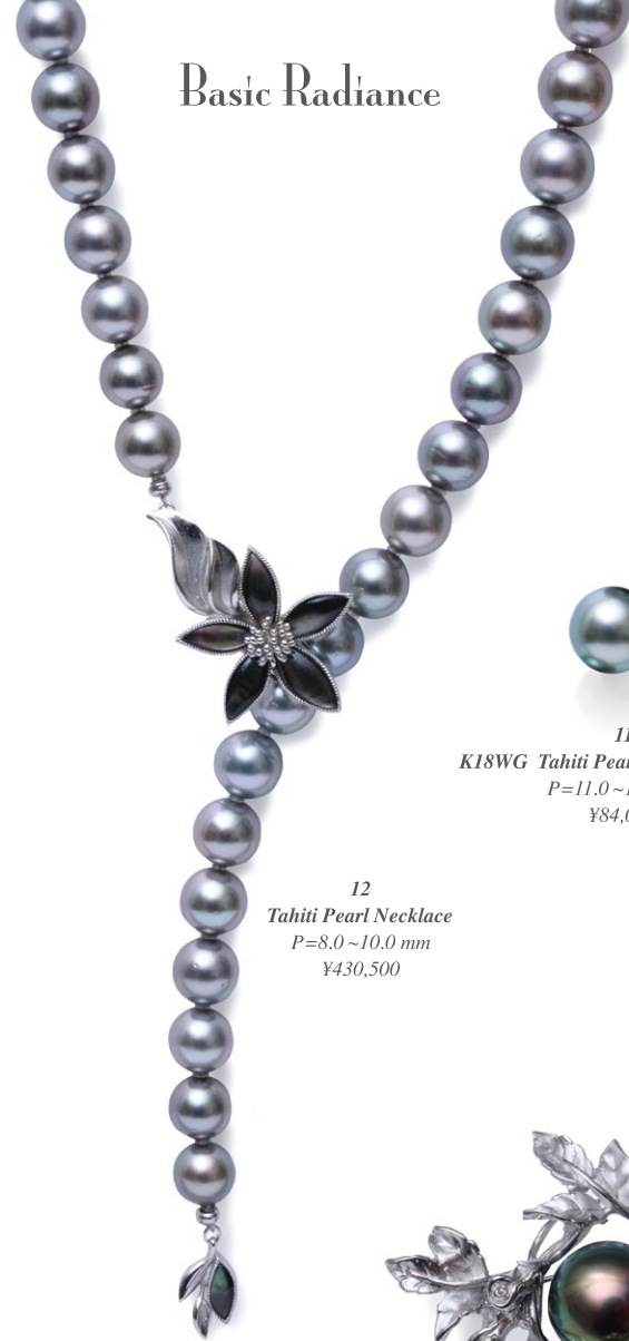
12 Tahiti Pearl Necklace P=8.0~10.0 mm ¥430,500