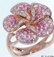
6 K18PG Pink Sapphire Ring PS=1.20ct D=0.25ct ¥336,000